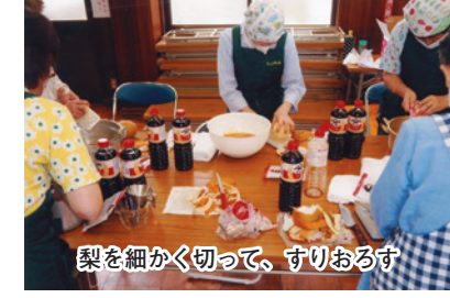
梨を細かく切って、すりおろす