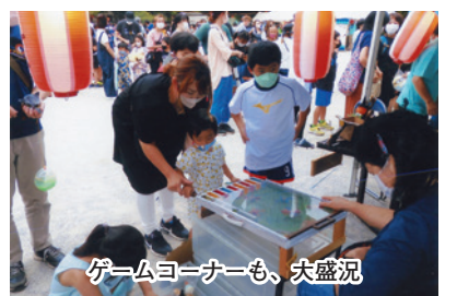
ゲームコーナーも、大盛況

が絶えませんでしたね。本部前では各団体の発表が行われました。歌と踊りの「丸山スペシャルメドレー」です。まずは子供達のヒップホップチームとダブルダッチが会場をノリノリにする。薄暗くなり、提灯にアかりが灯る。和太鼓の音とフラダンスの艶やかな舞いが夏らしさを演出する。降り始めた小雨の中、