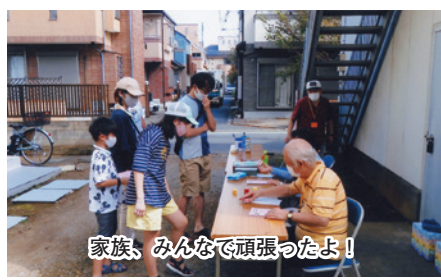
家族、みんなで頑張ったよ!

スタート受付は180名の受付を無事終了しました。今回は、コロナ禍でもあり、事情により、期間中に景品を受け取りに来れなかった方には、お届けいた