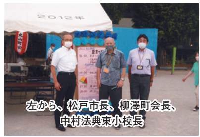
左から、松戸市長、柳澤町会長、中村法典東小校長