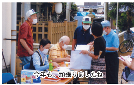
今年も、頑張りましたね

間の散歩orウォーキング ③朝のラジオ（テレビ）体操 ④食後の歯みがき ⑤血圧・体温を測る。薬を忘れずに飲む