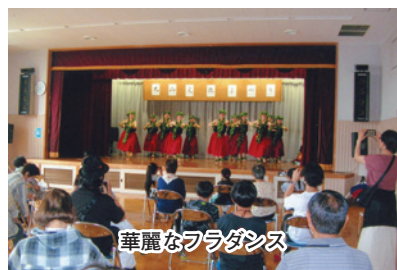
華麗なフラダンス

の元気なダンス、「笑南会」、「健無人の会」の独特な踊りと、皆さんが日々の練習の成果を発揮された素晴らしいものばかりでした。展示コーナーでは、小学生や幼稚園児の作品、盆栽、絵画、手芸、俳句、写真、民族衣装など、力作ばかりでした。