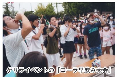
ゲリライベントの「コーラ早飲み大会」

8月20日、今にも降りだしそうな曇り空の中、法典東小学校の校庭で「丸山町会夏まつり」が開催されました。今年は、現地調理無しルールで、飲食店の店舗は少なめになりました。ゲームコーナーは、ベアーズ・ハッピースポーツ・育成会等が盛り上げてくれて、終始子供のはしゃぎ声