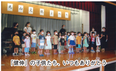
「健伸」の子供たち、いつもありがとう

外気温が三十度越えの真夏日を記録し、館内も大勢の来場者・出演者で熱気があり、真夏のような暑さでした。