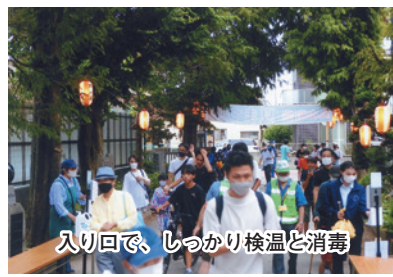
入り口で、しっかり検温と消毒

外気温が三十度越えの真夏日を記録し、館内も大勢の来場者・出演者で熱気があり、真夏のような暑さでした。