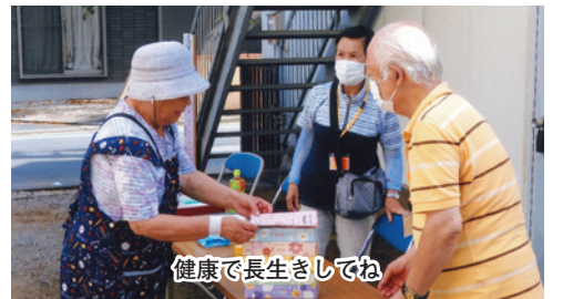
健康で長生きしてね