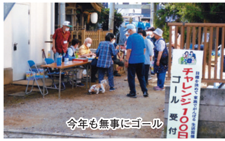
今年も無事にゴール

スタート受付は180名の受付を無事終了しました。今回は、コロナ禍でもあり、事情により、期間中に景品を受け取りに来れなかった方には、お届けいた