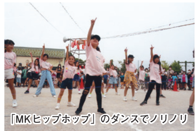
「MKヒップホップ」のダンスでノリノリ

夏まつり前日、天気予報は曇りか雨。中止が頭をよぎる。異常な暑さだった今年の6月、船橋市は次々と夏のイベントの中止を発表。丸山町会も内部で意見が分かれる。7月、丸山公民館で「丸山文化まつり」が行われた。