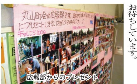
広報部からのプレゼント

「丸山町会文化まつり」に家族皆でいらしてください。町会のスタッフみんなまでお待ちしております。