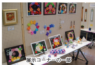
展示コーナーの一部

また、ボックスくじやピザの販売もあり、お祭りムードいっぱい催しが出来ました。三年ぶりの開催でしたが、マスクの着用、消毒の徹底など、皆様の協力もあり無事に終えることが出来ました。来年も町民参加型の「文