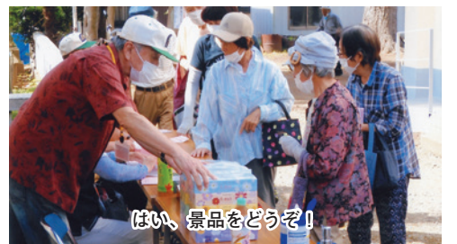
はい、景品をどうぞ!

88歳女性「椅子に座ってテレビ体操クリア。手にシールがあるので冊子にシールを貼るのが苦痛。でもこの冊子が後押ししてくれました。感謝」 何か目標を決めて続ける事が元気の基かなと思う。