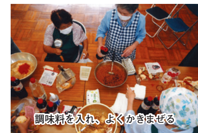
調味料を入れ、よくかきまぜる