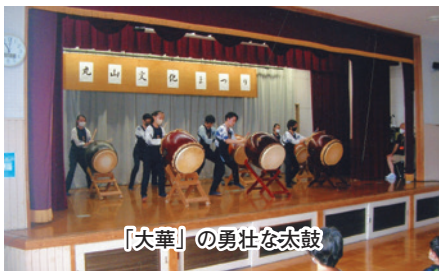
「大華」の勇壮な太鼓

夏まつり前日、天気予報は曇りか雨。中止が頭をよぎる。異常な暑さだった今年の6月、船橋市は次々と夏のイベントの中止を発表。丸山町会も内部で意見が分かれる。7月、丸山公民館で「丸山文化まつり」が行われた。