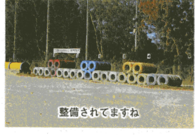
整備されてますね

【令和60年代・平成】 平成元年には、「わんぱ くタイム」という時間が設 けられました。朝のひとと きを1・6年生が学年に関 係なく班になって遊んだ り、給食も一緒に食べてい ます。