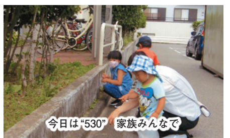
今日は「530」 家族みんなで