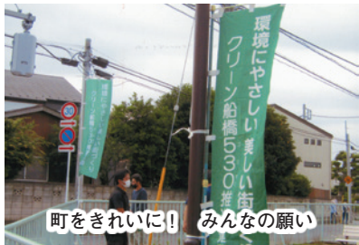
町をきれいに！ みんなの願い

は収束する事なく、増加・ 減少を繰り返して今日に至 っております。わが国でも医 療従事者や重症化の恐れあ る基礎疾患がある高齢者を 優先的にワクチン接種が始 まっており、丸山地域に於 いても順次ワクチン接種券 が届き、既に第一回目のワ クチン接種を受けた方が多 数おります。先ずは、中高 年層者が積極的にワクチン 接種を受けコロナウイルス 感染予防に努めてまいりま しょう。 会員の皆様が一日も早く ワクチン接種を済ませ、7月 から開催される東京オリ ムピック・パラリンピックを 家庭で元気にTV応援でき