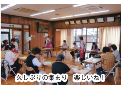
久しぶりの集まり 楽しいね!

令和3年度、婦人部は、 新しいメンバーを加え9名 で活動を開始しました。 昨年度は、町会行事が全 て中止となり、婦人部とし ての活動は十分に行えない 一年でしたが、今年こそは 何らかの活動を行おうとみ んなで考えました。 5月に初めての部会で、 一年間の行事を確認し、手 始めに「手芸講習会」を行 いました。5月29日、自治会館で行 いましたが、当日は、25名 が参加し和気あいあいと行 うことが出来ました。 当日の課題は「メガネ ケース」作りです。婦人部 の役員が材料を準備し、作 業のサポートをしました が、皆さん、さすが主婦の 手際良さを発揮し、上手に 仕上げておりました。 また、船橋市「シトラス リボン プロジェクト」に 賛同し婦人部・広報部の方 が沢山作ったリボンを、参 加者の方にお配りし、喜ん で頂けました。 これからも、丸山町会が 安心して暮らしやすい街に なるよう、思いやりの輪 を広げられたらと!! 婦人部では、「料理教室 (焼き肉のタレ)」「手芸講 習会(姉さん被りの帽子)」 を今後予定しております。 是非、ご参加ください。