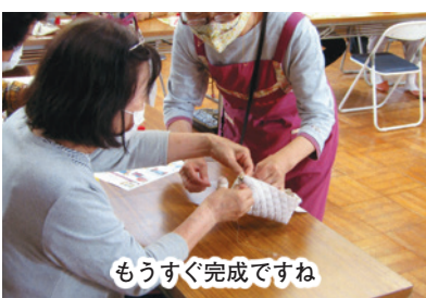
もうすぐ完成です