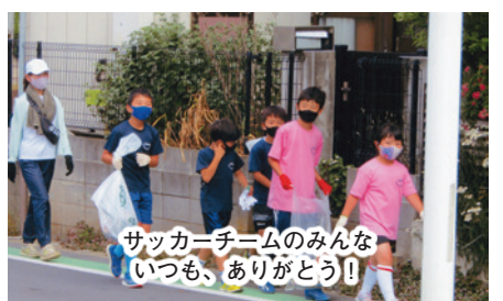
サッカーチームのみんな いつも、ありがとう!